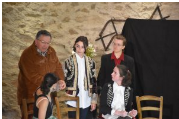
La Comédie du Conservatoire, le 17 mai au Théâtre Le Rex à Saint-Flour et le 31 mai au Cinéma La Source de Chaudes-Aigues.