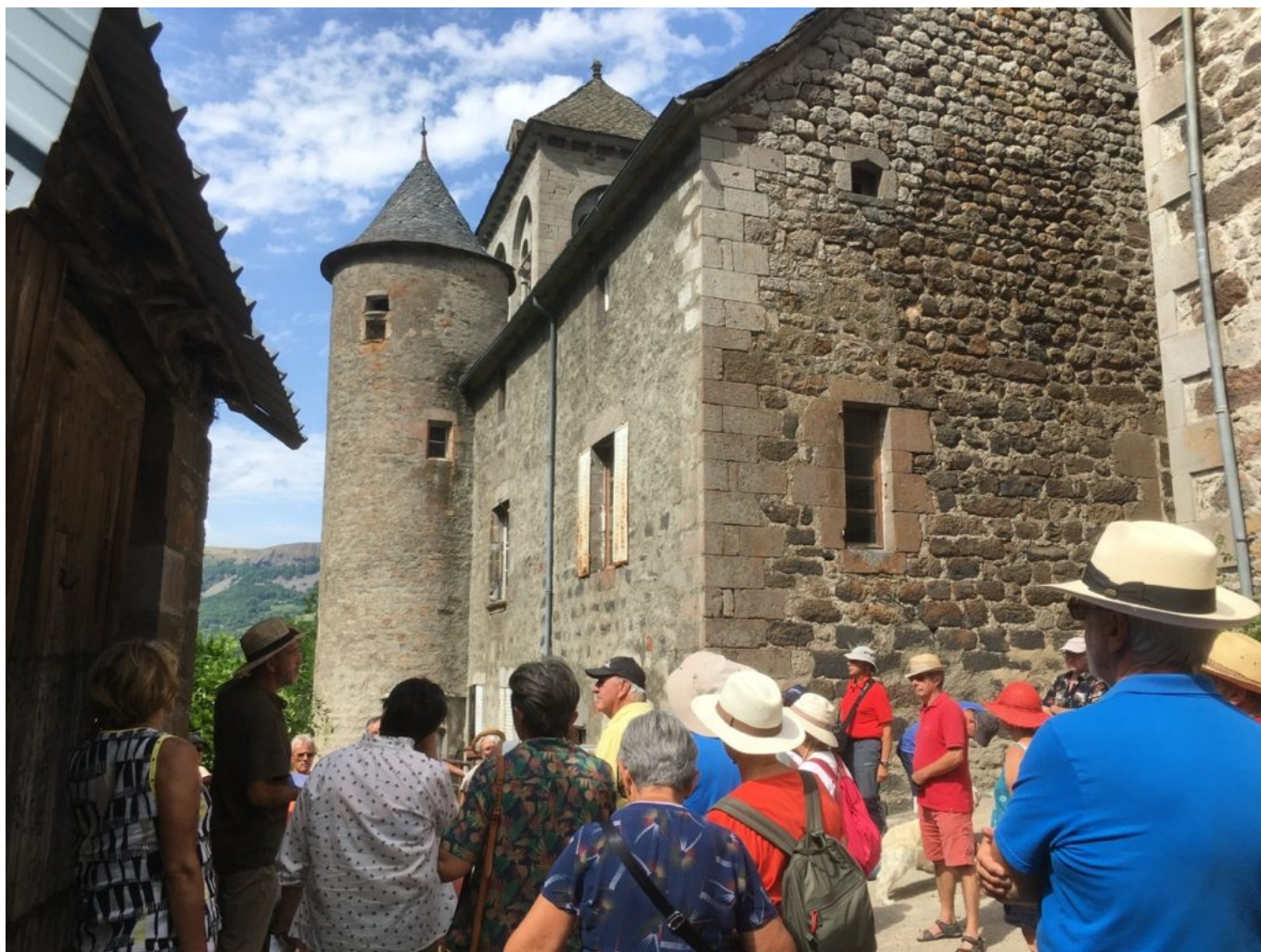
Un Village à l'honneur : Saint-Rémy-de-Chaudes-Aigues, Dimanche 21 mai à 15h.