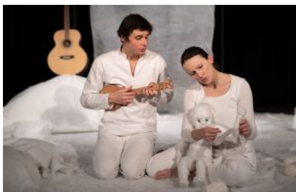
Ouatou, le 12 avril à 15h30 à Talizat.