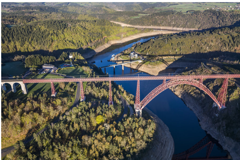
Viaduc de Garabit - ©Photo : Frédéric-LARREY - 2016

Poursuite de l'aide à l'acquisition de vélos électriques ; réalisation d'un Schéma Directeur Cyclable ; développement de la boucle cyclo-touristique de la Truyère ; étude pour le développement de dessertes saisonnières ; installation de bornes de recharge à vélos électriques ;