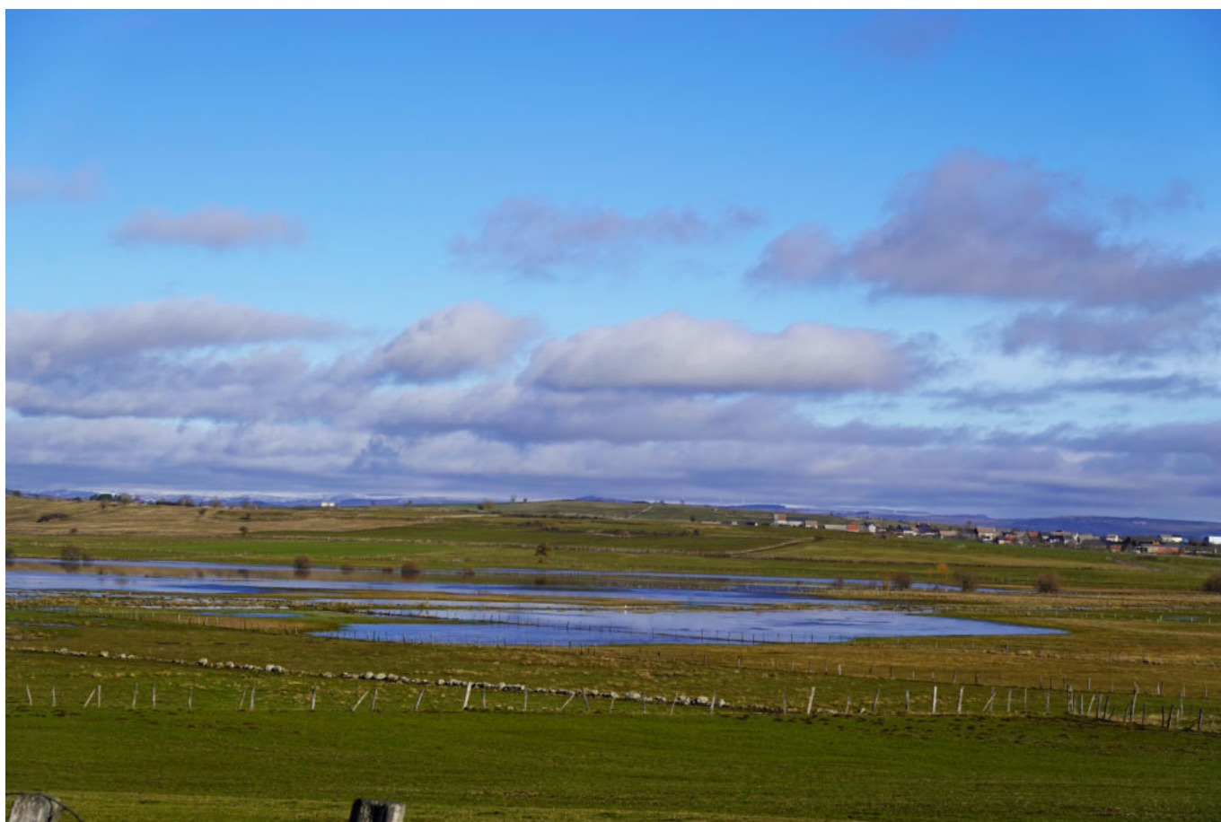
les Monts du Cantal à l'Ouest