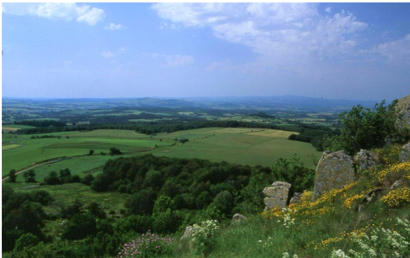
les hauts plateaux de l'Aubrac au Sud