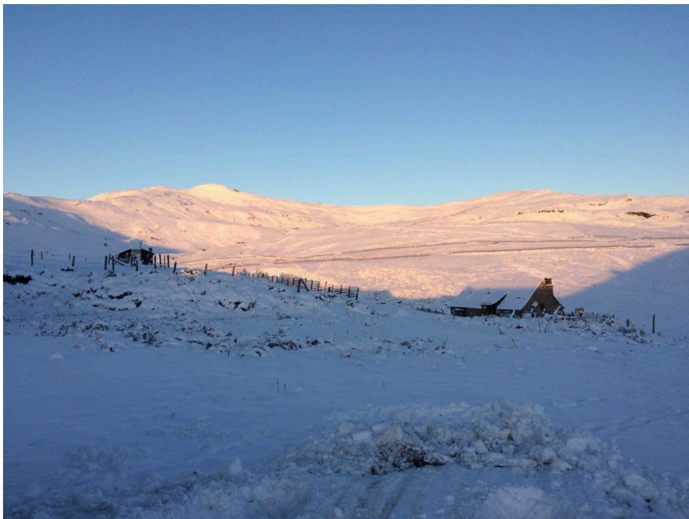
la Vallée et les Gorges de la Truyère qui traversent le territoire