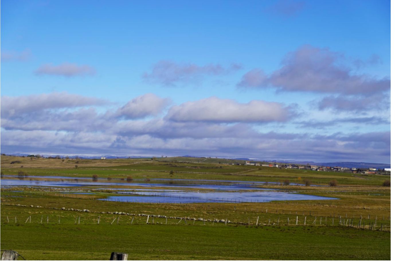
les Monts du Cantal à l'Ouest