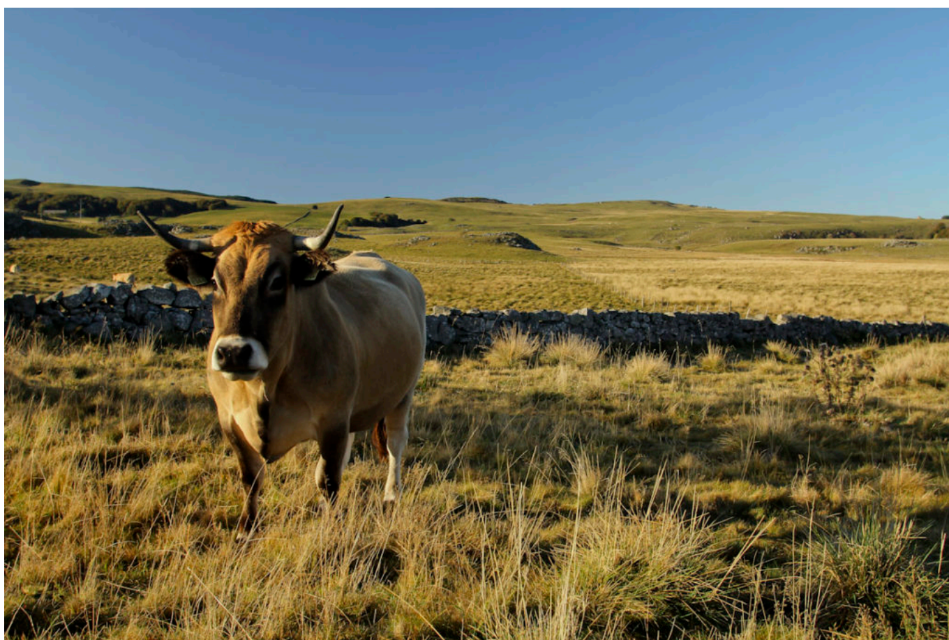
la Planèze de Saint-Flour au Nord