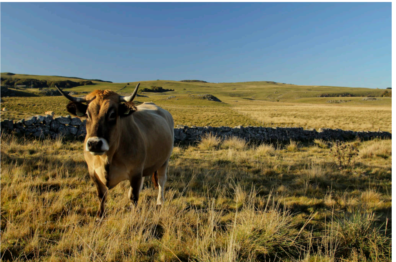
la Planèze de Saint-Flour au Nord