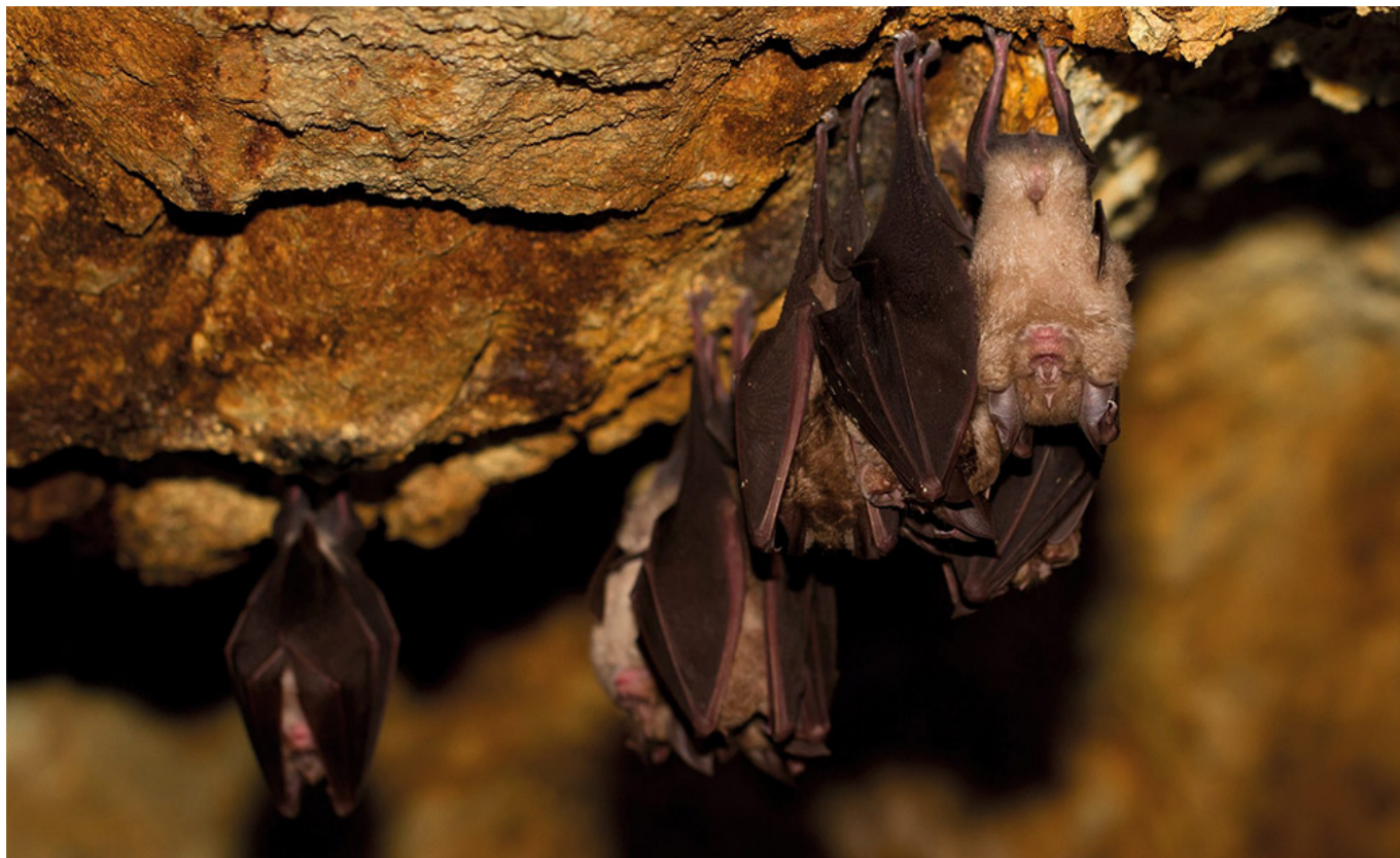
Le grand Rhinolophe