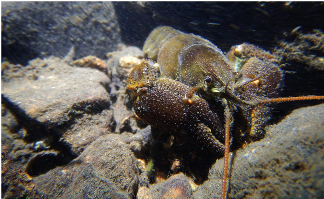
Écrevisse à pattes blanches