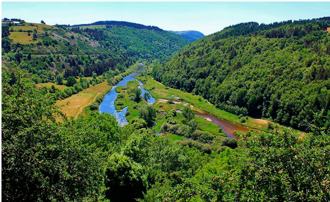
Gorges de la Truyère