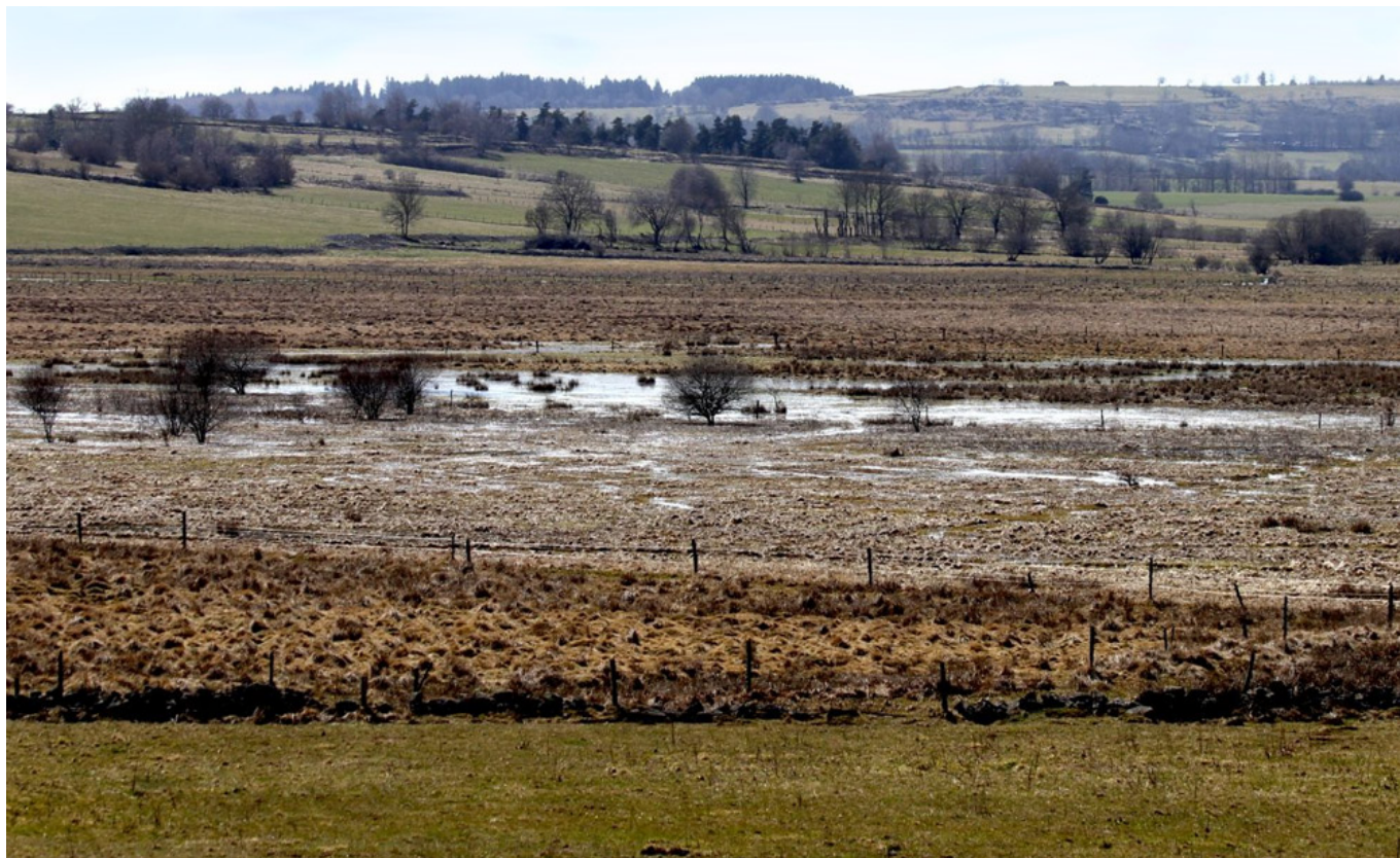
Narse de Lascols