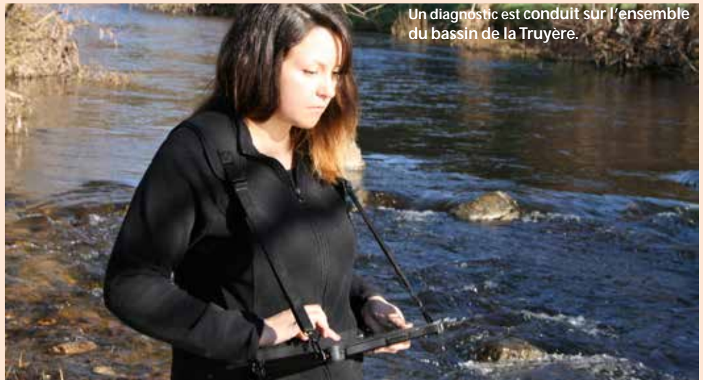
Un diagnostic est conduit sur l'ensemble du bassin de la Truyère.

LA TRUYÈRE ET SES GORGES CONSTITUENT UN OBSERVATOIRE FANTASTIQUE DE LA BIODIVERSITÉ DE PRENDRE PLEINEMENT VIE. SAINT-LOUR COMMUNAUTÉ DE DÉVELOPPEMENT DURABLE AVEC NOTAMMENT LE CONTRAT TERRITORIAL DES