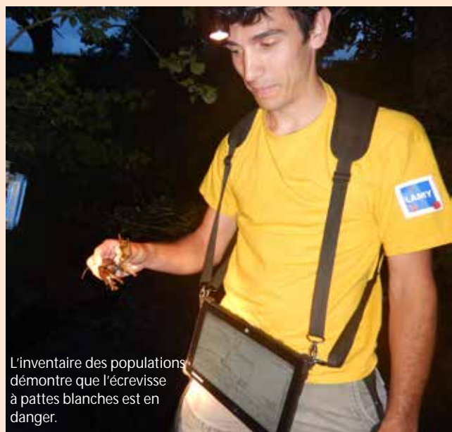
L'inventaire des populations démontre que l'écrevisse à pattes blanches est en danger.

L'objectif principal de cette étude scientifique est de connaître