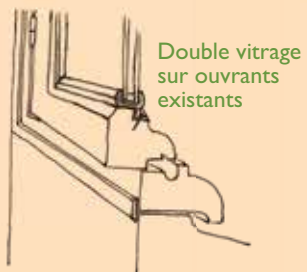
Double vitrage sur ouvrants existants