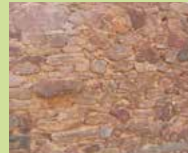
Atour de Ruynes-en-Margeride Mélange de schiste, basalte et granit