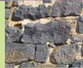
Atour de Paulhac Basalte de la Planèze