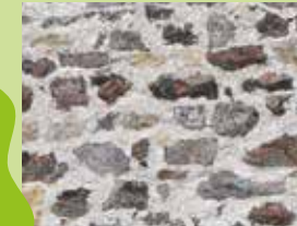
Différents types d'enduits

L'enduit permet également de différencier le logis de la grange. L'habitation plus soignée est traditionnellement rehaussée d'un enduit parfois décoré, destiné à mettre en avant le statut social du propriétaire. La grange, édifice utilitaire, ainsi que les ouvrages secondaires étaient montés en pierres apparentes avec des joints dits « beurrés ». La qualité d'un ensemble bâti est directement liée à la coexistence d'édifices destinés à être enduits, et d'autres conçus pour rester en pierres apparentes. Cet équilibre est fragile et subtil, un langage à conserver.