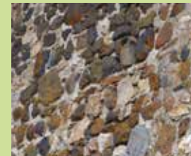
Atour de Lastic Trachyte, trachyandésite