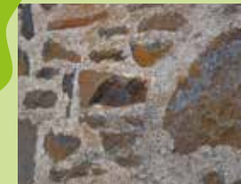
Les enduits à « joints beurrés »