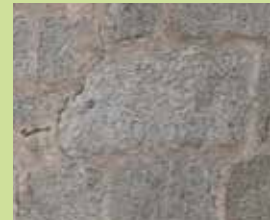
Atour de Saint-Just Granit