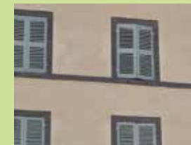
Les enduits « pleins »