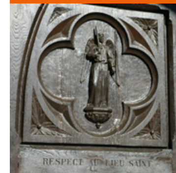
Détail de la porte d'entrée.