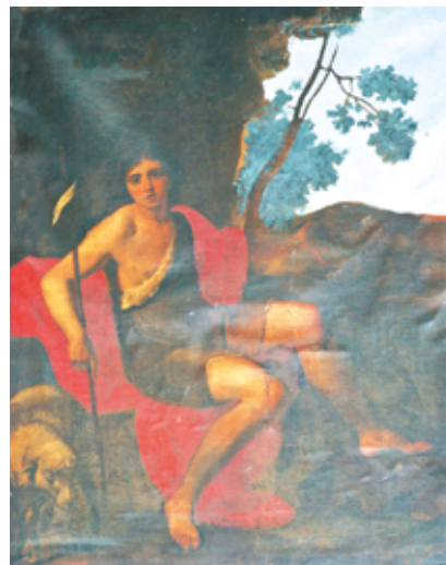
La toile représentant saint Jean-Baptiste au désert semble de facture ancienne (XVII e siècle ?) et a été offerte en 1829 par M. Etienne Lapeyre.

dans une famille bourgeoise, il séjourne une dizaine d'année à Rome où il apprend à représenter, entre autres sujets, de beaux vieillards vigoureusement éclairés suivant la technique caravagesque. Le tableau de Lavastrie, restauré en 2012, montre le moment où saint Pierre se repent amèrement d'avoir trahi le Christ. De grosses larmes coulent de ses yeux rougis. Vignon peindra ce thème à plusieurs reprises, mais l'oeuvre de Lavastrie possède une grande profondeur psychologique du fait de la sobriété de sa composition. Elle appartiendrait à la dernière manière du peintre et aurait pu être réalisée vers 1630 pour Pierre Séguier, chancelier de France.