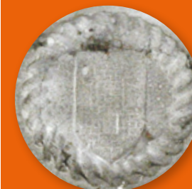
Les armes de la famille d'Apchier, en clé de voûte et sur le clocher, qui possédait des terres à Lavastrie.